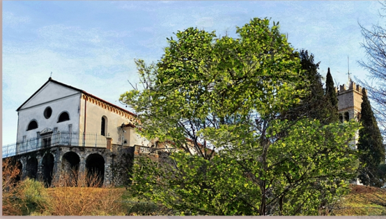
cartolina n.18 della mappa