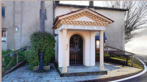
cartolina n.16 della mappa